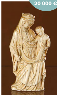
XIV e siècle Vierge à l'Enfant