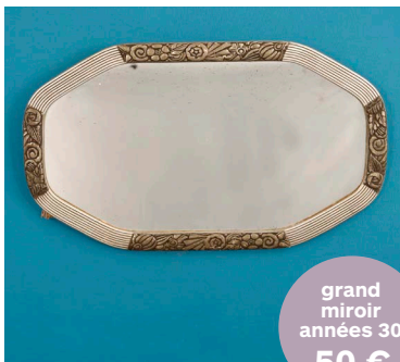
En bois argenté - 66 x38 cm