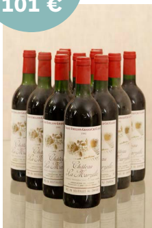
Château La Marzelle, Saint-Émilion, 12 bouteilles, 1981