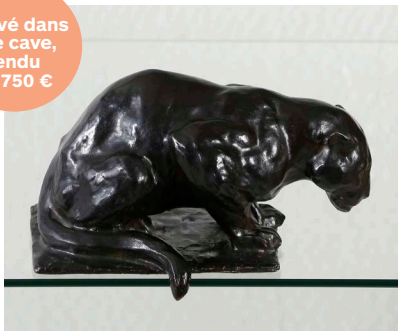
Rembrandt Bugatti, Jaguar