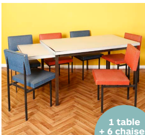
Dieter Wäckerlin, circa 1960

2. enchérissez ! en venant à la vente ou en live depuis chez vous ou en vous faisant appeler au téléphone